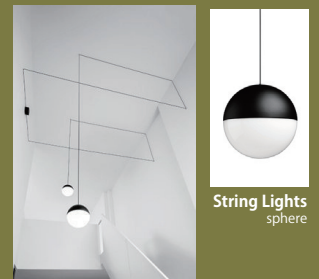
String Lights sphere

1967年キプロス島生まれ、ロンドンの大学で土木技術を学んだ後、ロイヤル・カレッジ・オブ・アートで工業デザインを学び、1994年にロンドンに自身のスタジオを設立。作品はニューヨーク近代美術館、V&A 博物館などのパーマネントコレクションに選定されている。球体や三角錐など基本的にシンプルな形のデザイン。