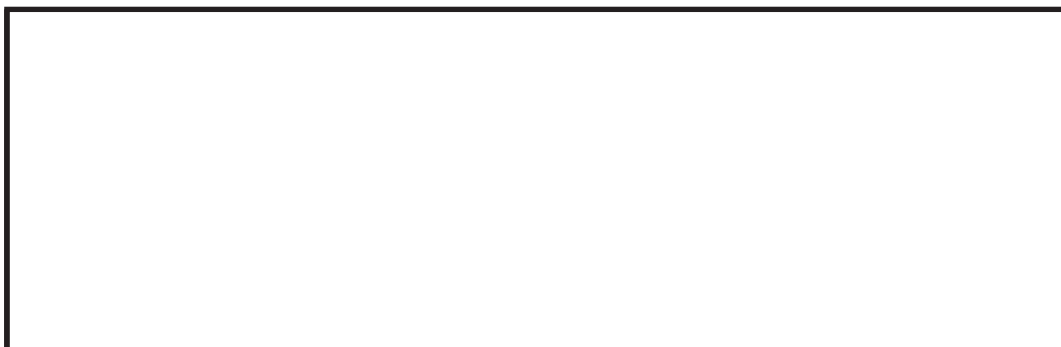
String Lights by Michael Anastassiades