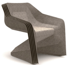
Hemp Chair by Werner Aisslinger

1964年ドイツ生まれ。1991年ベルリンの芸術大学卒業。1989年スタジオ・デルッキやロンドンでジャスパー・モリソンとロン・アラドと共にデザイン活動を行う。1993年スタジオ・アイスリンガーを設立。コンパッソドーロ賞やレッドドット賞など数々の賞を受賞。ヴィトラ・デザイン・ミュージアムやニューヨーク現代美術館などで作品が展示。