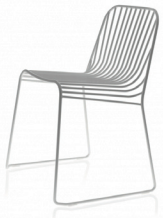
SPLINE by ANDERSSSEN & VOLL

Torbjørn AnderssenとEspen Vollによるノルウェー出身のデザインユニット。Anderssenはミュージシャンと教育者、Vollは陶芸家と建築家の両親を持ち、共にクリエイティブな家系で育つ。両者 Bergen Academy of Art and Design と Oslo National Academy of Art を卒業した後、2000年に Norway Says を立ち上げる。ノルウェーデザインをリードする若手。