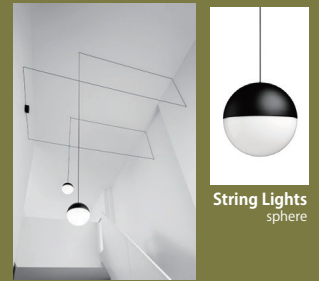
String Lights sphere

1967年キプロス島生まれ、ロンドンの大学で土木技術を学んだ後、ロイヤル・カレッジ・オブ・アートで工業デザインを学び、1994年にロンドンに自身のスタジオを設立。作品はニューヨーク近代美術館、V&A 博物館などのパーマネントコレクションに選定されている。球体や三角錐など基本的にシンプルな形のデザイン。