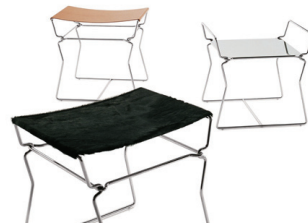
PYLON by Nicole Aebischer

1980年スイス生まれ。Ecole Cantonale d'Art de Lausanne で工業デザインを学ぶ。2003年のサローネや2004年の Designers' Saturday (ランゲントール)にてスツール「Pylon」を発表。2002年には D&AD Student Awards の大賞受賞。卒業後は Bread&Butter (スイス) や Norway Says (ノルウェー) など、世界各国のデザイン集団と仕事を手掛け、グラフィックデザイナーでもある。