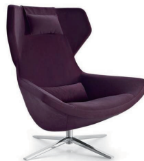
METROPOLITAN '14 by Jeffrey Bennett

1964年イリノイ州生まれ。1995年ニューヨークを拠点とするデザインコンサルティング会社を設立。1996年ニューヨーク国際現代家具見本市にてコレクションを発表、エディターズアワード最優秀賞受賞。家具、照明器具、企業のアートコレクションなど、ヨーロッパ企業との仕事はアメリカに於いてヨーロッパデザイン存在感をより確率させた。