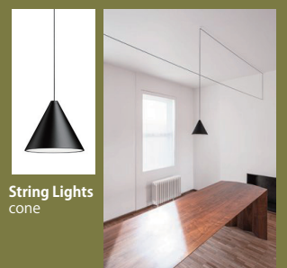
String Lights cone