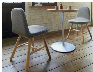
MALUI by PROCEED

丸二金属製作所の店舗、オフィス、飲食店など、対応した業務用家具ブランド PROCEED。今年も新しいカタログが届きました。テーマは Simple Design・Compact Design・Storage Designと三つの切り口で家具を提案。MALUI は名のごとく丸みを帯びたキュートなウッドチェア。どこか懐かしさを感じる丸棒で作った脚部のデザインが印象的。