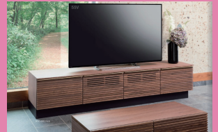
UNITY by MK maeda