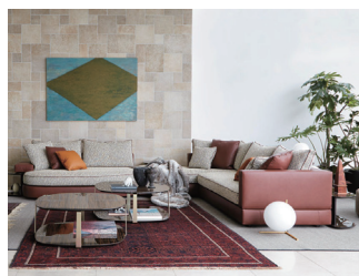
GRAN by Ludovica+Roberto Palomba

座ることを様々な形で楽しめる、自由な発想のソファ。ラウンド型のユニットでは周囲からアクセスし易いことで、人が集う中心となり、直線型のユニットではフォーマルで端然とした佇まいに。シンプルな形状、バリエーションのシステムであっても多彩な表現力を発揮。クッション部は、多層構造に加えて、マイクロファイバーの使用により、座り心地と高い復元力を備えている。