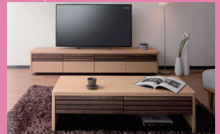
MODY by MK maeda