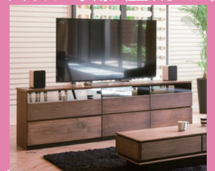
FINE by MK maeda

リビングシーンだけでなくダイニングやベッドルームにもテレビをという声で生まれた FINE。エッジに丸みを帯びたフォルムとシックな木目のコンビネーションが特徴的な UNITY。人気を博している MK マエダのルーバーシリーズの中でも最も繊細でスタイリッシュな印象に仕上げた MODY。