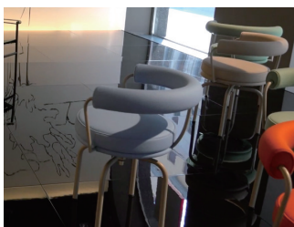
LC by Le Corbusier, Pierre Jeanneret, Charlotte Perriand

Cassinaでは2015年はル・コルビュジェ、ピエール・ジャンヌレ、シャルロット・ペリアンによるLCコレクションの復刻生産を開始してからちょうど50年になり、ル・コルビュジェの没後50年の年でもあります。大気汚染の六価クロムに代えクロム化合物のより少ない三価クロムを採用。レザーはオーガニックレザーに変更。環境にやさしいLCです。