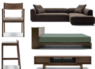
WILDWOOD by Master Wal

マスターウォールの名前の由来でもあるウォールナットへのこだわり。そのうつくしさと特性を尊重し、素材への追究を忘れることなく100年後の人たちにも愛着を持ってもらえるような家具づくりを目指しています。NEW COLLECTIONが豊富なアイテムで追加になりました。アカセ木工のブランドMaster Wal。100年後のアンティーク家具へ。