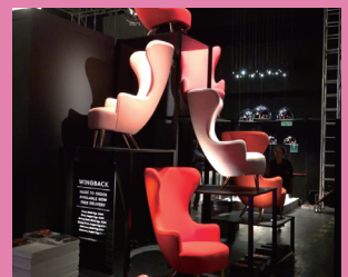
wing back chair by Tom Dixon

樹種に造詣が深いプロが厳選する無垢材英国のデザイナー Tom Dixon のブランドの TOM DIXON SHOP が渋谷に7/17オープンする。家具、照明はもちろん、フレグランスやホームアクセサリなど約 600 種類を展開。空間プロデュースも Tom Dixon 自身が手がけ、Tom Dixon ワールドを体感できる。東京都渋谷区渋谷 2-1-13 http://www.tomdixon.jp