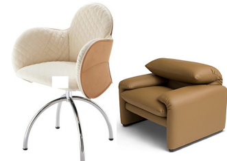
INCISA by De Padova MARALUNGA by Cassina

1920年、ミラノ生まれ。ミラノ工科大学で建築を学び、父親のデザイン事務所に就職。都市計画、建築、インテリアデザイン、インダストリアルデザイン、Cassinaで家具デザインを手掛け、その後De Padovaのメインデザイナーに、1956年にイタリア工業デザイン協会を設立、2度にわたるイタリアコンパッソドーロ賞受賞。戦後イタリアのデザイン復興の中心的人物である。