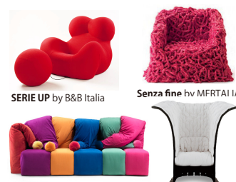
Il Giullare by MERTALIA

1939年にイタリアのLa Spezia生まれ。ペニスのIUAVで建築を学び、1980年には自らデザインコミュニケーションセンターを設立。B&B Italiaでは女性の体をかたどったSERIE UPが有名。CassinaのFELTRIやMERTALIAのLa MichettaやIl Giullare (道化師) や Senza fineなどアバンギャルドなデザインが得意で、日本でも南船場にあるオーガニックビルが有名です。