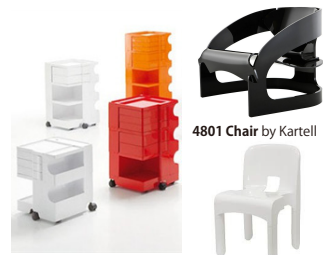
Bobby Trolley by Bieffeplast

1930年、ミラノ生まれ。1951年に前衛美術集団モヴィメント・ヌークアーレを結成。抽象絵画や彫刻等を手掛けるアーティストとして活動する。1962年にミラノにデザイン事務所を開設し、インテリア、プロダクトデザインを始める。アクリルを光らせる画期的な照明「アクリリカ」が有名。1971年にこの世を去るまで10年あまりの間に数々の名作を残す。