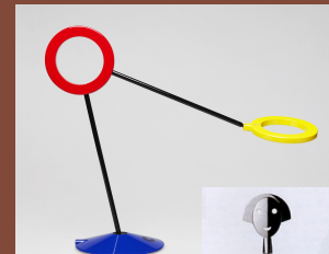
AMULETO by RAMUN