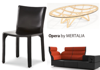
CAB by Cassina Freud by MERTALIA

1935年、ミラノ生まれ。ミラノ工科大学で建築を学び、1963年タイプライターで有名なオリベッティ社のデザイン顧問に就任。カッシーナやヴィトラで家具、日本では象印やヤマハの電気製品、アルテミデ、フロス、アルコの照明など数多くデザインを手掛ける。建築・デザイン誌「ドムス」の編集長を、1986年から5年間勤め、近年ではMERTALIAの家具も好評。