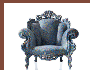
MAGIS PROUST by MAGIS

1931年ミラノ生まれ。ミラノ工科大学で建築を学び、1960年代はニッツォーリの建築事務所勤務。1968年より建築誌カサベラに勤務。1972年編集長に就任。反インダストリー・反大量生産のラディカル・デザイン運動の学校「グローバル・トゥールズ」を設立。1978年にはアヴァンギャルド・デザインのスタジオ・アルキミアに参加。