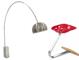
Arco by FLOS

1918年、ミラノ生まれ。ミラノ工科大学で建築を学び、1944年から兄のピエール・ジャコモとともに建築家・デザイナーとしてスタート。1962年のフロス社創設にデザイン部門責任者として兄弟で参画。新しいテクノロジーと多様な素材を用いて実験的に伝統的なフォルムを表現。イタリアデザインのマエストロ、革新的な工業デザインのパイオニアと賞賛。