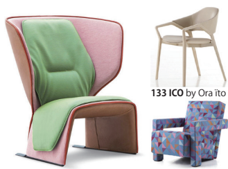
570 GENDER by Patricia Urquiola

パトリシア・ウルキオラ Cassina では Patricia Urquiola がアートディレクターに就任。Urquiola と言えばショールームではお隣の B&B Italia の主力デザイナーの1人。MOROSO でも会場デザインを手掛けているが、今回 Cassina の Fiera 会場デザインを担当。新作のラウンジチェア Gender は彼女らしいフォルムです。Ora ìto オラ・イト のチェア ICO や Gerrit Thomas Rietveld の UTRECHT C90 Limited Edition が印象的。