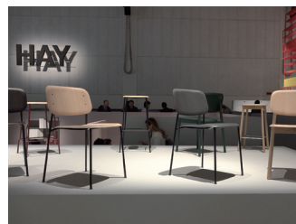
HAY at PELOTA JAIALAI

デンマークで人気の HAY がブレラ周辺のスタジアム「PELOTA JAIALAI」を会場に HAY のソファやチェアが一同に展示。競技する場所は一段低くなっているので、そこに 10 個の部屋を作り降りて見られるようにしている。庭には PALISSADE 緑の野外用家具を展示。また別会場では MINI とのコラボレーションで「MINI LIVING」HAY の家具を使った空間が素敵だった。