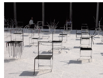
50 manga chairs by nendo

佐藤オオキ率いる nendo の「50 manga chairs in Milan」作品全部をペラペラ漫画のようにして見れば作品が繋がっているのがわかる。漫画は輪郭線で構成されることによる平面性と抽象度の高さを伴った表現手法である。宮殿の中庭にシンプルなイスをグリッド状に 50 脚並べ、それぞれが独立した家具としてではなく、お互いの関係性をそれとなく感じさせることを試みた。