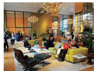
Casa Vitra by Hella Jongerius

vitra は CORSO COMO 周辺の建物を会場に Casa Vitra という展示を行っていた。入口の庭ではオープンカフェを展開。1 階には Eames のシェルチェアなどの部品を使って回転する歯車のようなオブジェが展示。2 階はサロン風に vitra のソファにゆったり座れる空間。コーナーでは会議室のような部屋もあり、Hella Jongerius の色と素材のライブラリを満喫できる。