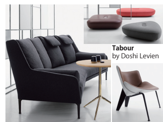
Édouard by Antonio Citterio

アントニオ・チッテリオ 創業 50 周年を迎える B&B ITALIA。今年の新作は Antonio Citterio デザインのソファ Édouard。背の高さが 2 種類あり、デザイン、座り心地もそれぞれ違う。組合せによっては広い空間にも対応。 モバ・ドッシ ジョナサン・レビン Nipa Doshi と Jonathan Levien によるデザインデュオ Doshi Levien は公共スペースに腰掛けソファとして機能する Tabour と小柄な肘掛け椅子 Do-Marú、テーブル Maru をデザイン。