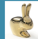
Rabbit Chair by Stefano Giovannoni