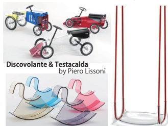
H-Horse by nendo

今年の展示テーマは「Kartell presents Talking Minds」。デザイナーの大きな顔写真をブースのアイコンに 11 の部屋に分けて、新作や既存の製品をコーディネートして展示されていた。また Kartell Kids と題して子供用の家具を発表。新しく nendo も加わり透明の木馬 H-Horse をデザイン。Piero Lissoni 車 Discovolante & Testacalda。Philippe Starck ブランコ AirWay を発表。