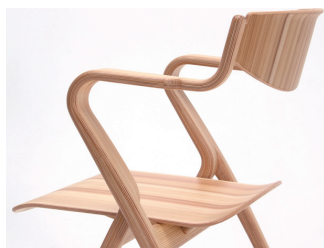
Roll Press Wood Chair by Motomi Kawakami

Roll Press Wood。天童木工の成形合板技術を組合せることで、軟質針葉樹に十分な強度を持たせると同時に、本来の木目の美しさを活かしながら、針葉樹であっても自由なデザインを可能にしました。ぬくもりのある木の表情を活かしながら、難燃・防腐・防蟻などの機能性を付加した、デザイン性の高いアイテムをつくり出すことを可能にします。