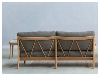
FAWN SOFA by Tomoyuki Matsuoka

白い雪深い森そこに子鹿 (FAWN) がたたずんでいます。大自然の豊かさを忘れてはいない。大自然で育った心を忘れてはいない。都会のコンパクトな建物の中で生き甲斐を感じながら働き、自然を愛し続け、生きている人の心の中を表現しました。匠芸が大自然の中で実直に作るFAWNを通じて豊かな大地の恵みを感じ取っていただけるきっかけが出来れば嬉しく思います。