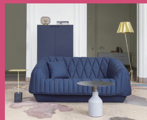
COVER 2 by Marie Christine Dorner

COVER というソファはその名の通りカバーがベースに覆いかぶさった構造になっています。特徴的なキルティングモチーフはとても複雑な縫製が必要で職人が丁寧に仕上げていきます。ベースとカバーは異なる生地で張ることができます。美しいシェーブとソフト感が快適な空間と時間を提供してくれるソファです。