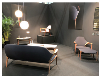
KUNST Arm chair by Jin Kuramoto

カリモクブランドとイノダ+スバイエの新しいストーリーが始まります。《KUNST》と名付けたコレクションは、デンマーク語で《美術・アート》の意。とことん彼らが信じる最高の美学を貫き徹し、全てのディテールにまで命を吹き込みました。日本最高レベルのハイテク施設と技能を兼ね備えたカリモク社と共に日々進化する家具《KUNST》ブランドを築きあげていきます。