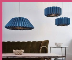
MEGA TWO by Tage Klint

LE KLINT 社の原点であるペーパーシェードをさらに進化させ、現代版として新たに2つのペンダントが仲間入りです。1945年にTage Klintがデザインしたクラシックシェードモデル2からインスピレーションを得て、新たに誕生したデザイン。プリーツの広がり美しく拡大された細部からは、折り職人たちの技術力の高さを見ることができます。