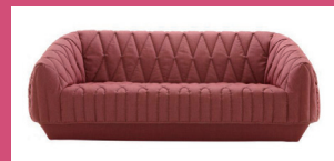
ダイヤとストライプのキルティングモチーフから構成