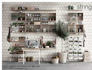
string by String Furniture

ストリングファニチャーはストリングシェルフシステムを牽引する北欧のデザイン企業です。スウェーデンの建築家ニルス・ストリニングが考案したストリングシェルフはタイムレスデザインの象徴で、そのミニマルな形は世界中で知られています。豊富なアイテムから自由自在に使えるストリングシステムはオフィスやモダンな住宅、都市型のコンパクトなリビングに最適です。