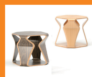
LEXUS Collection Stool by Tendo Mokko