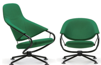
Citizen by Konstantin Grcic

ウィトラ コンスタンティン・グリュック vitraのKonstantin Grcicデザイン「Citizen」 は、これまでにないデザインと、スチール製のフレームに3点の細いケーブルで座面を吊るす事により驚くべき座り心地を実現した、次世代のラウンジチェアです。スチール製のカンチレバーフレームと固定脚が回転構造ユニットに連結し、柔軟で自由度の高い動きを生み出します。構造は隠さず、スチールフレームもあえて見せたままで、スポーティで、気取らない印象です。ハイバックとローバックの展開。