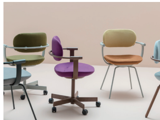
Vertebra03 by Furnie Shibata

背と座が自然と動き、そんな姿勢でも座る人の身体に優しくフィット。人間工学に裏付けたその画期的な座り心地で高い評価を得てきたイトーキの"Vertebra"シリーズをさらにアップデート。一体化してフレームの肘部と背もたれに搭載した機能によりスムーズなロッキングを実現。前傾・直立・後傾・ストレッチ姿勢に自在に対応するだけでなく、背の動きに追求するように三次元形状のシートがスライドすることで自然と正しいポジションに導きます。