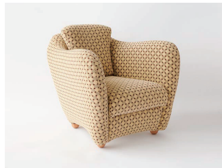
MINI MILLER ARM CHAIR by Matthew Hilton

ミニミラーアームチェアコレクション MINI MILLER ARM CHAIR に、IDEE × Svensson モデルが数量限定で新登場。テキスタイルメーカー Svensson の洗練された北欧デザインと、高品質な素材、卓越した技術から生み出されるファブリックを使用した限定モデルです。一見ドット柄にも見える、直線で構成されたモダンな柄の"VELVET" MIRAを張り地に採用しました。幾何学的なパターンでありながらも暖かみやオーガニックな雰囲気があり、飽きのこないデザインです。