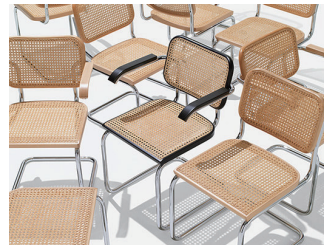
Cesca Chair by Marcel Breuer

バウハウスの創立宣言(1919年)より100年を記念し、マルセル・ブロイヤー Marcel BreuerのCesca Chairがマシンウーヴン(機械編み)となり、新価格でKnollから販売となった。Marcel BreuerのCesca Chairは、伝統的な職人技と工業的な手法や素材を組み合わせ、モダンに仕上げたスチールパイプ製の家具です。スチールパイプ素材ならではの特性を利用したカンチレバーのフォルムが、柔軟性のある快適さを与えています。1928年に誕生して以来、愛されています。