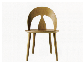
J45 by Børge Mogensen

エフディービー・モブラー コーア・クリント FDB MøblerはKaare Klintが監修を担い、初代にBørge Mogensen, Poul M. Voltherが2代目の代表を務めました。Hans J. Wegner やアルネ・ヤコブセン ボーエ・モーエンセン Børge Mogensenの独創的なデザインがプロジェクトメンバーに名を連ね数々の名作を世に送り出し、その後の北欧デンマーク家具の模範となり、今日目にする数々のデンマークデザインが生まれました。2020年の新カタログにはBørge Mogensenデザインの名作チェアJ45が復刻。背に成形合板を用いた独創的な椅子。