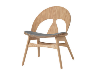
BM099P CONTOUR CHAIR by Børge Mogensen

コントラールチェア 1949年にデザインされた、CONTOUR CHAIR。Børge Mogensenの独創的なビジョンから生まれた才気溢れる一脚です。背には当時まだ新しい素材であった、成形合板のシェルを使用。無垢材を使用したフレーム、角度を付けた脚、緩やかな曲線を描く座面。大きな特徴となっている背を形成する成形合板製のシェル、オーガニックな形状に施された切り抜きが印象的です。また接合部に、ほぞ継ぎや楔を用いるなど、細部へのこだわりも生きています。