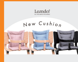
Leander New cushion by Stig Leander

デンマークの子供家具メーカー、Leanderのハイチェア用クッションが新しくなりました。生地の素材にはオーガニックコットンを使用しております。頻繁な洗濯にも耐えることができ、柔らかい肌触りでお子さまの座りをサポートします。お子さまに有害な物質は一切含んでおりません。ハイチェアの色やお部屋の家具にも馴染むモダンな色合いのクッションです。パッケージは環境にやさしい100%リサイクル可能なペーパーを使用しています。