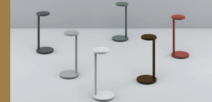
Oblique by Vincent Van Duysen