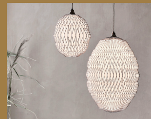
stock stack by KOKUYO FURNITURE

デンマークの人気番組“Danmarks næste klassiker”『デンマークの次 なる名作』をきっかけに生まれた CALEO。 名前はラテン語に由来し、「ハイライト する」という意味です。LE KLINTの伝統 に基づいて、紙製のブリーツのシェ ード選んだデザイナーは、折り目にブロン ズ色を施すことで、美しく細かな折りを 際立たせました。職人技が光る、細部 までこだわった外観からは、LE KLINT ならではの柔らかな光を放ちます。