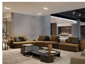
Saint-Germain by Jean-Marie Massaud

ポリフォーム PoliformのSaint-Germainは、しなやかで 官能的な形のソファと室内装飾品のシス テムです。直線的なソファ、L字型の構成、 または有機的な構成を特徴とするシリー ズのすべてのモジュールで、包み込むよ うなラウンドスタイルが繰り返されます。 ファブリックまたはレザーのカバーは、 ボリュームをフルで官能的に高めます。 Jean-Marie Massaudによって設計され、あ らゆる空間を暖かく親しみやすい風景に変え、 家庭的な快適さを心地よく感じさせます。