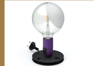
Lampadina LED by Achille Castiglioni