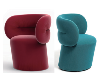
Getlucky by Patricia Urquiola

パトリシア・ウルキオラ Patricia UrquiolaデザインのGetluckyは 柔らかい背もたれがリボンのように背中 を包み込み、快適な座に絡み合います。 デザインの優雅さとフォルムの優雅さを 兼ね備えた精密なライン。この椅子に座 ると背もたれとシートは幾何学的な形に なり、完全にバランスが取れています。 Getluckyチェアで、座席と背もたれが平 衡状態で幾何学的な形になると、「姉妹」 であるRuffラフ ラフラフソファと合わせると、 形の間の対話が厳肅で彫刻的になります。