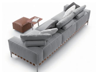
Gregory by Antonio Citterio

フレックスフォーム FLEXFORM から Antonio Citterio の新作 Gregoryの大胆な個性と絶妙なプロポー ションは、洗練された構造のディテール を明らかにし、あらゆる生活空間で舞台 の中心にしっかりと配置します。独特の メタルベースにはエレガントな牛革が巻 かれ、革の暖かさによって和らげられます。 ソフトクッションの輪郭を描くパイピング のクチュール仕立てによって、フォーマル で美的なソリューションは、遺伝的遺産の 本質である専門知識にまでさかのぼります。