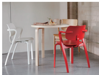
Aslak Chair by Ilmari Tapiovaara

アルテック arteckのビーチ材による曲線が美しい アスラク チェア Aslak Chairは、軽量で持ち運びが容易、 スタッキングも可能な機能的なデザイン ゆえに、あらゆる環境において変わること のない普遍的な存在。三次元に曲線を 描く人の身体に沿った座面など、長期間 座っても疲れにくく、心地良く過ごせる デザインを追及しています。カーブを描く 短めの肘置きは、肘置きとしての役割を きちんと果たしながら、テーブルに椅子 を引き寄せやすいように考慮されている。